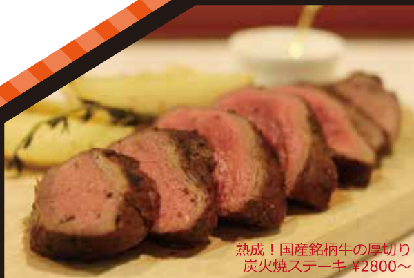
熟成！国産銘柄牛の厚切り 炭火焼ステーキ ¥2800~

にぎやかな南口商店街をくぐり、代田の高級住宅街に向かって進むと右手に見えるのが南仏地中海料理をベースにしたフランスの郷土料理で代沢、代田マダムを虜にするワイン食堂。今話題の食材本来の味をひきだす低温スチーミングで調理法で作られたメニューは五感で楽しめる。またポリフェノールたっぷりの黒ワインも下北沢ではココならではの。食べるもよし、飲むもよし。両方すればなお楽しめるお店。